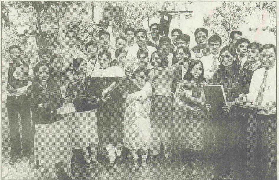
Students of various colleges who were selected during a campus drive at Pioneer Institute in the City by Tata AIG Life Insurance Company.