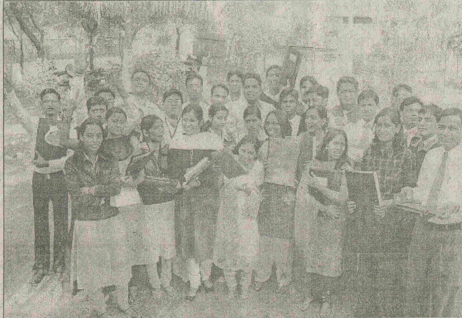
पायोनियर इंस्टीट्यूट में अपने चयन के बाद भावी मैनेजर।