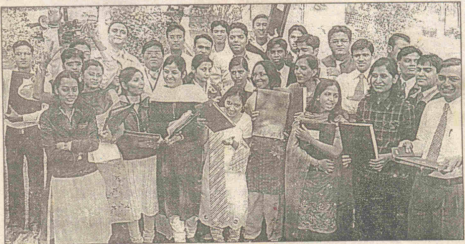
ड्राइव में उपस्थित छात्र-छात्राएं.