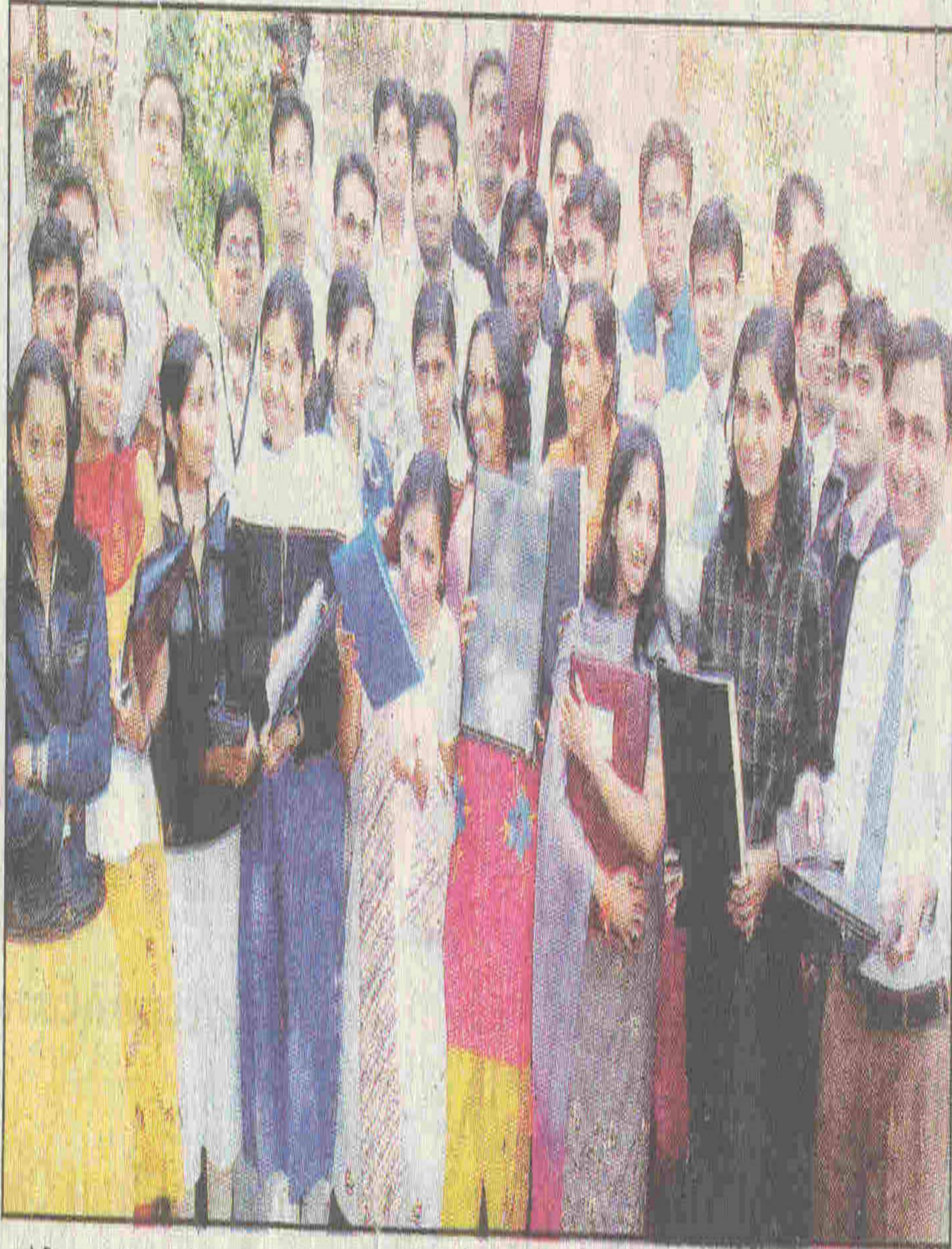
पायोनियर इंस्टीट्यूट में टाटा एआईजी लाइफ इंश्योरेंस कंपनी के कैम्पस ड्राइव में शामिल उत्साहित विद्यार्थी।